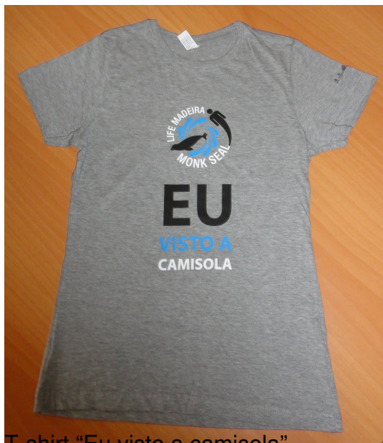
T-shirt “Eu visto a camisola”